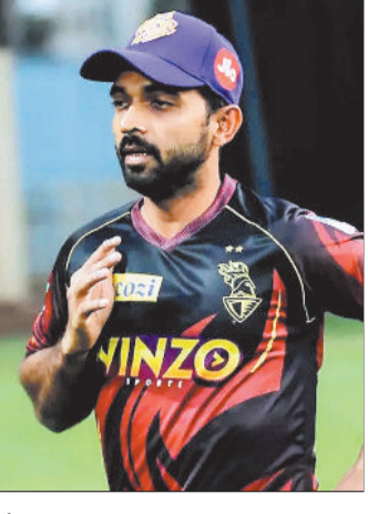
मैच बारिश में धुलने से उसे एकमात्र अंक मिला है।

शानदार फॉर्म में चल रही राजस्थान रॉयल्स पिछले मैच में मिली हार को भुलाकर जीत के लिए तरस रही कोलकाता नाइट राइडर्स के खिलाफ रिविवा को आईपीएल के मैच में लय वापिस पाने के इरादे से उतरेगी। टूर्नामेंट की सबसे मजबूत टीमों में से एक रॉयल्स और खराब फॉर्म से परेशान केकेआर के बीच यह मुकाबला होगा। राजस्थान ने लगातार चार जीत हाज्र की लेकिन पिछले मैच में उसे सनराइजर्स हैदराबाद ने हराया। वहीं केकेआर छह मैचों में एक भी जीत हासिल नहीं कर पाई है। अजंक्य रहाणे की कप्तानी में केकेआर कई मैचों पर जीत के करीब पहुंचकर हार गई है, जिससे टीम का आत्मविश्वास डगमगा गया है। पंजाब किंग्स के खिलाफ