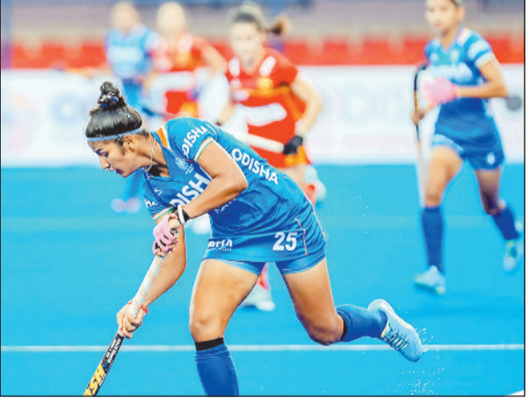
एजेसी ►► ब्यूनास आयर्स