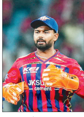
मुकाबले जीते हैं, जो उसके दबदबे की बानगी है।

तालिका में शीर्ष पर काबिज पंजाब किंग्स रिविवा को आईपीएल मुकाबले में संघर्ष कर रही लखनऊ सुपर जाइंट्स के खिलाफ अपनी जीत की लय बरकरार रखने के लिए मजबूत बल्लेबाजी पर भरोसा करेगी। लखनऊ की टीम कप्तान ऋषभ पंत की चोट को लेकर भी चिंतित है। पंजाब किंग्स इस सत्र में अब तक एकमात्र अजेय टीम रही है। टीम ने पांच में से चार मुकाबले जीते हैं, जबकि केकेआर के खिलाफ एक मैच बारिश के कारण रद्द हो गया था। श्रेयस अय्यर की अगुवाई वाली टीम का नेट रन रेट +1.067 है, जो उसकी दमदार बल्लेबाजी और सघे हुए लक्ष्य-पीछा करने की क्षमता को दर्शाता है। पंजाब ने 2025 सत्र से अब तक लक्ष्य का पीछा करते हुए अपने पिछले 11 में से नौ