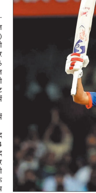
टिम डेविड ने किए आईपीएल में एक हजार रन पूरे

गेंदबाजों के शानदार प्रदर्शन के बाद केएल राहुल (57) और ट्रिस्टन स्टब्स (नाबाद 60) की अर्धशतकीय पारियों की मदद से दिल्ली कैपिटल्स ने इंडियन प्रीमियर लीग में शनिवार को रॉयल चैलेंजर्स बेंगलुरु (आरसीबी) को 6 विकेट से शिकस्त दी। सलामी बल्लेबाज फिल साल्ट की 38 गेंद में 63 रन की आक्रामक पारी के बावजूद कैपिटल्स ने आरसीबी को 8 विकेट पर 175 रन पर रोकने के बाद 19.5 ओवर में चार विकेट पर लक्ष्य हासिल कर लिया। कैपिटल्स के लिए राहुल ने 34 गेंद की पारी में दो छक्के और चार चौके लगाए। टीम के 18 रन पर तीन विकेट गिरने के बाद उन्होंने स्टब्स के साथ चौथे विकेट के लिए 44 गेंद में 69 रन की साझेदारी की। इसके बाद स्टब्स ने कप्तान अक्षर पटेल (26 रन पर रिटायर हट) के साथ 35 गेंद में 47 रन की अटूट साझेदारी की। अक्षर चोटिल होने के कारण 16वें ओवर में रिटायर हट हो गए। स्टब्स ने संयमित बल्लेबाजी करते हुए 47 गेंद की नाबाद पारी में एक छक्का और चार चौके जड़े, जबकि डेविड मिलर (नाबाद 22) ने आखिरी ओवर में लगातार गेंदों पर दो छक्के और एक चौका लगाकर टीम को जीत दिला दी। आरसीबी के लिए भुवनेश्वर कुमार ने चार ओवर में 26 रन देकर तीन विकेट लिए, जबकि कृणाल पंड्या ने 24 रन देकर एक विकेट हासिल किया।